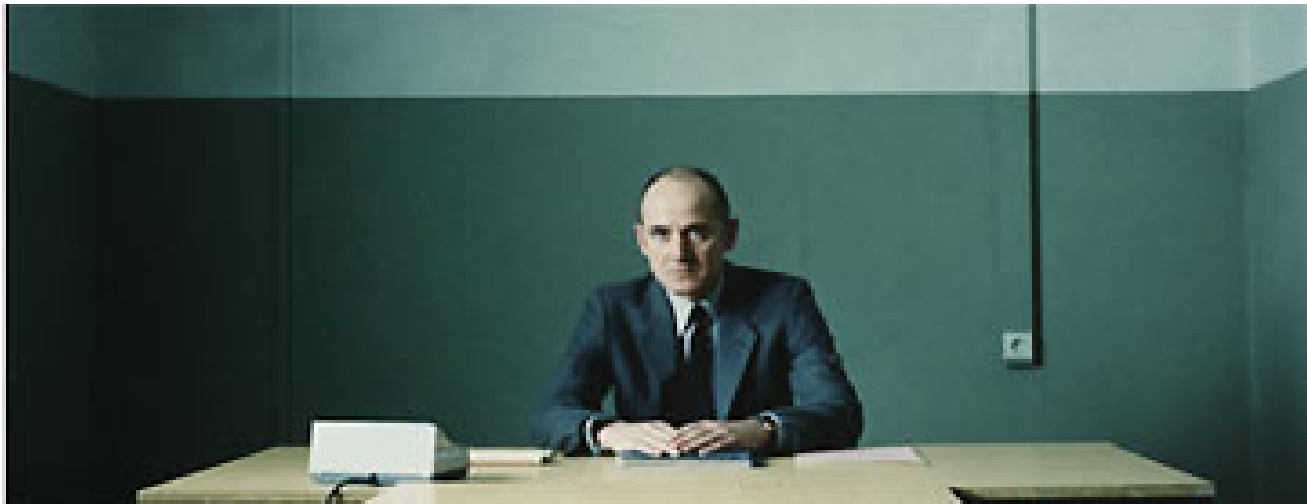
Bild aus „Das Leben der anderen“ von Florian Henckel von Donnersmarck